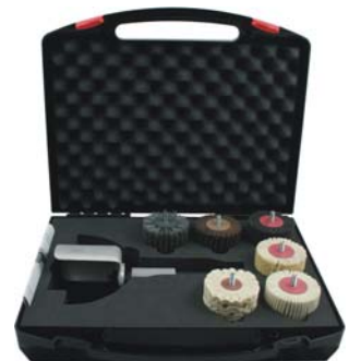
bestückt mit GX30/30