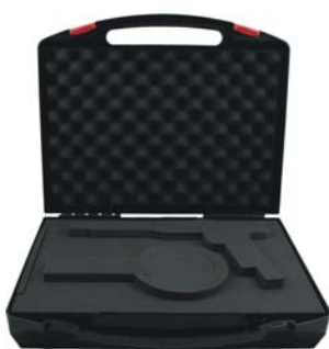
Koff-K Uni 1