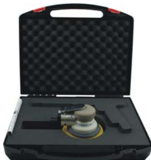
bestückt mit APS150