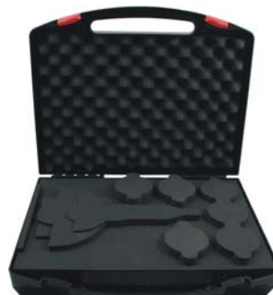
Koff-K Uni 2