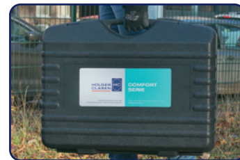
Werkzeug, Akku und Ladegerät sicher verstaut in einem Koffer Tool, battery and charger safely stored in a case

The performance upgrade for your tool park – the consistent further development of our proven battery tools with more compatibility through the 18 V Makita battery. Significantly more performance and powerful details for optimal work processes ensure more efficiency on the job. Take a big step forward together with us.