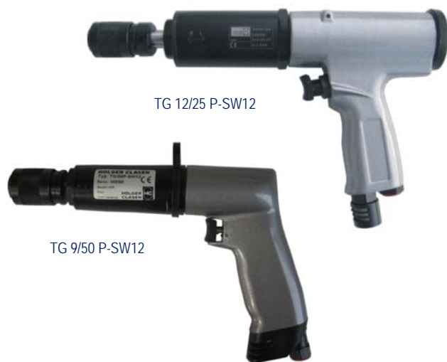
TG 12/25 P-SW12